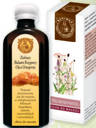
Na stawy i kręgosłup

Czasy w jakich żyjemy sprawiły, iż większość aktywności handlowej przeniósł się do internetu. Ta sytuacja niesie ze sobą pewne zagrożenia również dla zielarstwa. Chcielibyśmy ostrzec pacjentów, którzy poszukują surowców zielarskich w internecie, aby zaopatrywali się przede wszystkim na legalnie działających stronach sklepów zielarskich i aptek. Zakup surowców zielarskich na popularnych platformach sprzedażowych, polskich lub też zagranicznych, niesie ze sobą ryzyko, że surowce zielarskie będą niskiej jakości, a mogą być wręcz trujące. Pamiętajcie, że lek roślinny to produkt, który musi być odpowiednio pozyskiwany, przechowywany i transportowany. Legalnie działające na rynku polskim sklepy zielarskie i apteki gwarantują taką jakość, najczęściej umożliwiają również konsultacje telefoniczne i internetowe z fachowym personelem pracującym w tych placówkach. Zatem jeżeli możesz kupić zioła od fachowca, nie kupuj od „byle kogo”.